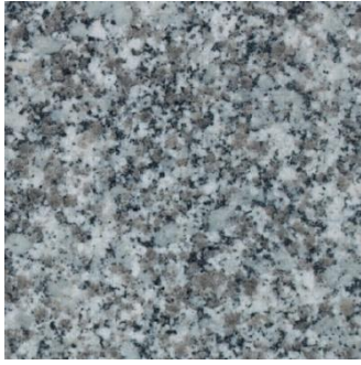
Fig.3: Granito Azul Transmontano.