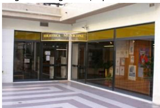
Fig.2: Biblioteca Municipal de Alverca.

O Centro Comercial Parque, construído nos finais dos anos 80, início dos anos 90, é um local de comércio. Este tomou o lugar de uma antiga fábrica de cerâmica, ficando para sempre perdidas as suas chaminés icónicas, das quais não existe registo fotográfico, apenas uma pintura no núcleo museológico de Alverca. À rua onde fica localizado o Centro Comercial foi atribuído o nome Brigadeiro Alberto Fernandes Oliveira, um piloto aviador e depois engenheiro aeronáutico pertencentes aos quadros dos engenheiros das OGMA em 1953.