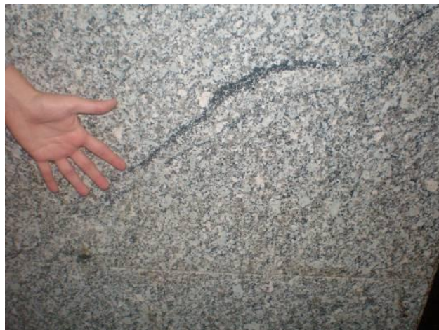
Fig.7: Pormenor da parede – biotite.