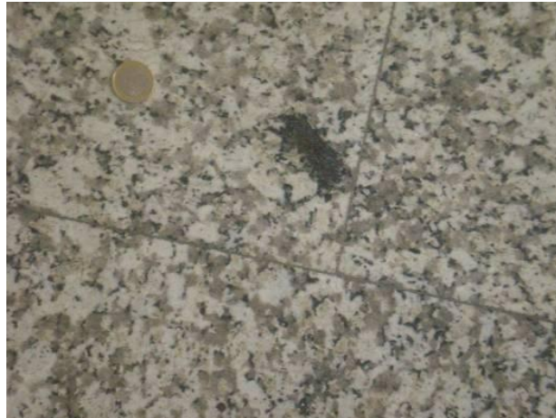
Fig.8: Pormenor do chão – biotite.