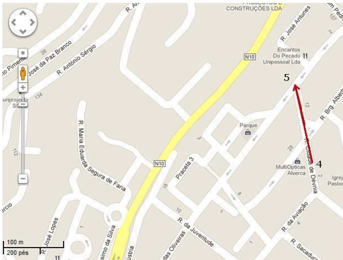
Fig.1: Localização do Centro Comercial Parque (Imagem retirada do Google maps).