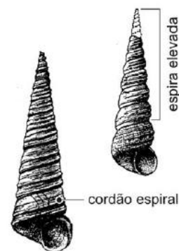
Fig. 1 Turrítella

Na calçada da Rua José Ferreira Tarré podemos encontrar associado ao calcário de liós fósseis de turrítelas que são Moluscos da classe dos gastrópodes que se distribuiu pelos mares Mediterrâneo e do Norte, pelo oceano Atlântico e pelo canal da Mancha, do Cretácico (145 - 65 M.a.) à atualidade. Estes gastrópodes, bentónicos, pouco profundos (infralitoral), de substrato móvel, possuem concha enrolada com forma de cone alongado que podem ter um tamanho até 15 cm, turriculada. Estes organismos, filtradores viviam em ambientes marinhos com salinidade normal e temperatura variável.