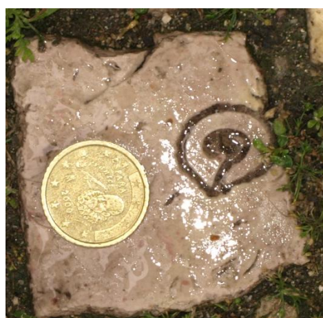
Fig. 3- Turrítella (Corte Longitudinal)