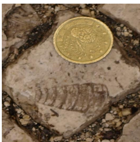
Fig. 2- Turrítella (Corte Transversal)