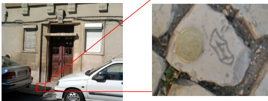
Fig. 4 - Turrítella (Rua Joaquim Sabino Faria - Prédio Nº10)

Neste momento propomos que descubram os fósseis das fotografias que se seguem.