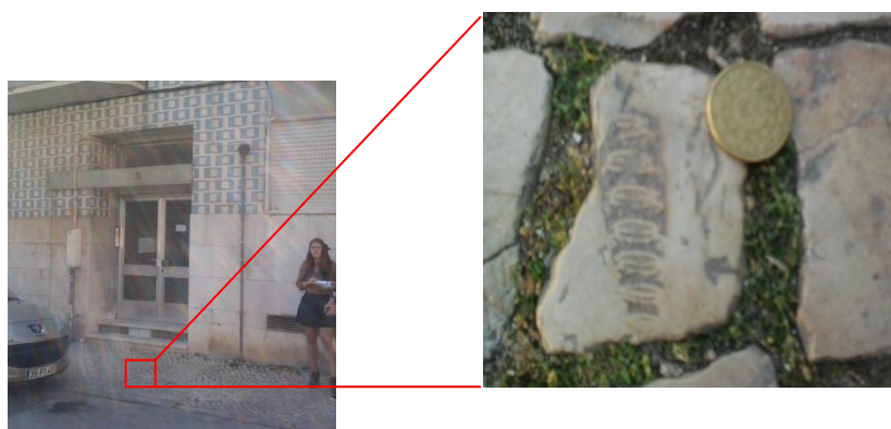
Fig.6 – Turrítela (Rua José Ferreira Tarré – Prédio Nº13)