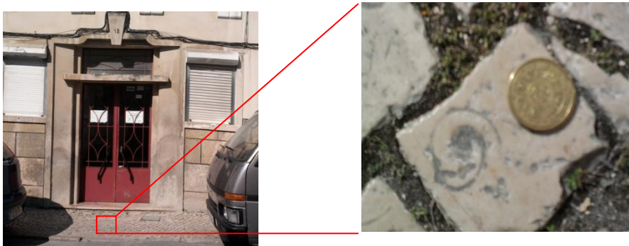
Fig. 5 – Turrítela (Rua Joaquim Sabino Faria – Prédio Nº12)